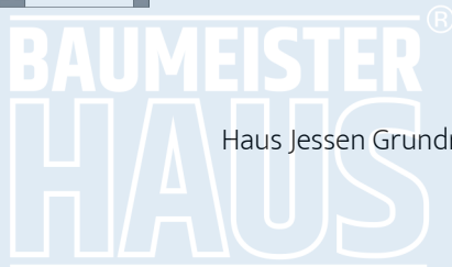
Haus Jessen Grundriss