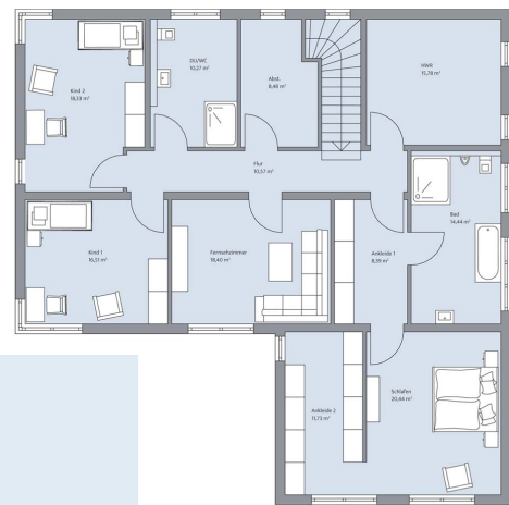
Haus Zech Grundriss